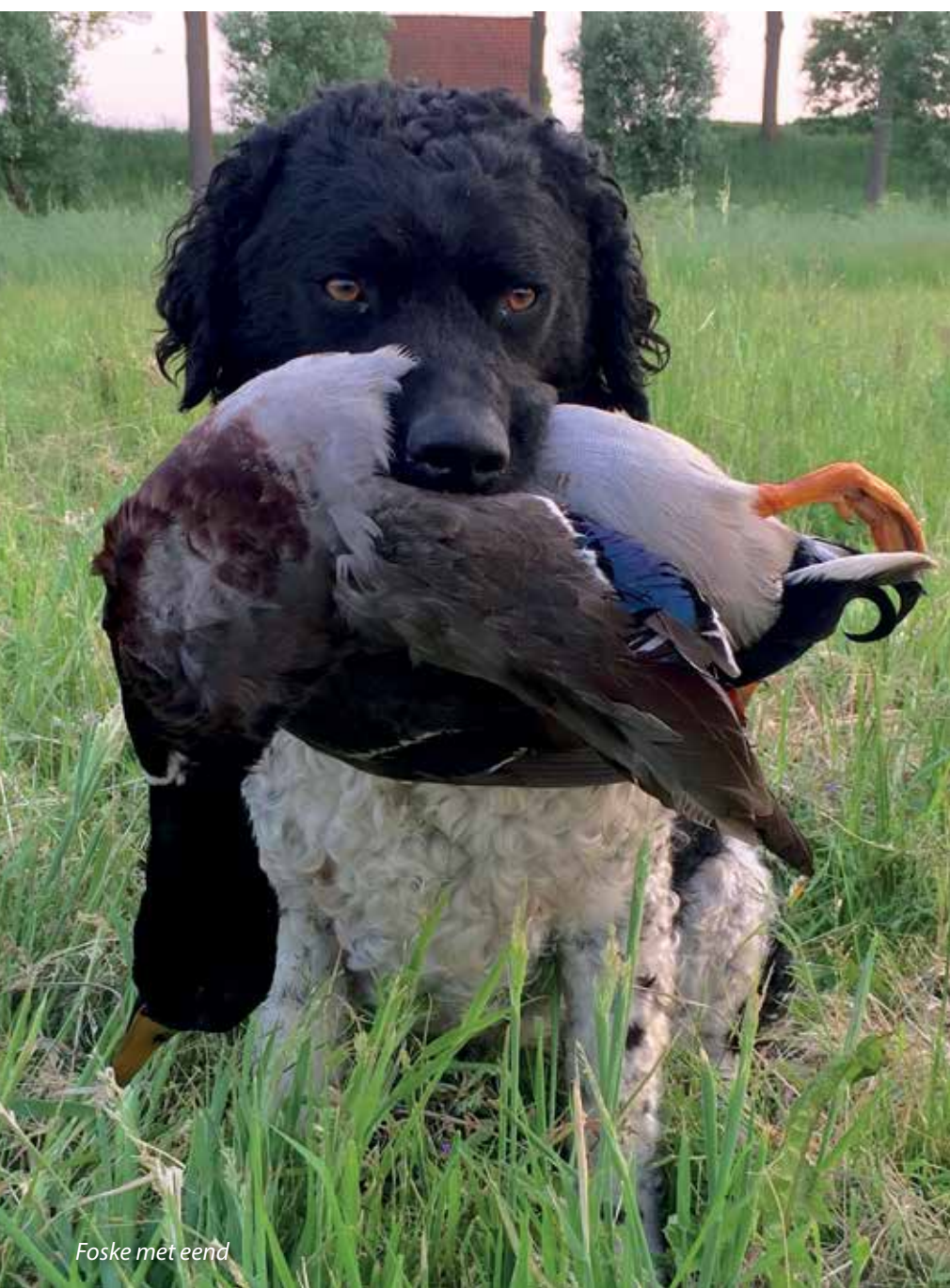
Foske met eend