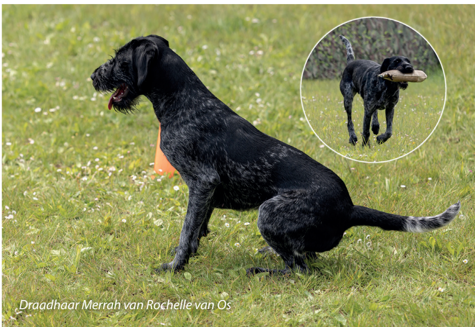
Draadhaar Merrah van Rochelle van Os

Bij de volgende opdracht wordt drie keer achter elkaar een markeer met schot gedaan, waarbij de voorjager na elk apport een eindje naar achteren op de nieuwe inzetplaats positie kiest. De afstand wordt dus steeds groter, en ook het apport wordt steeds moeilijker te zien omdat er eerst een witte dummy wordt gegooid, dan een zwarte, en tot slot een groene. De helper staat bij deze oefening in een bosje, wat ook spannend kan zijn. Tot nu toe bestaat de opbouw uit kleine stapjes omhoog in moeilijkheidsgraad van nog steeds eenvoudige apporten. De verschillende 'foutjes' die worden gemaakt, zoals inspringen, te veel moeten zoeken en ererondjes, worden stuk voor stuk vergezeld van advies. Waar wenselijk wordt de oefening nog eens opnieuw gedaan. Een van de belangrijkste adviezen is toch wel om de hond pas in te zetten als er rust op de inzetplaats is, en een goede focus. Het ligt zo voor de hand,