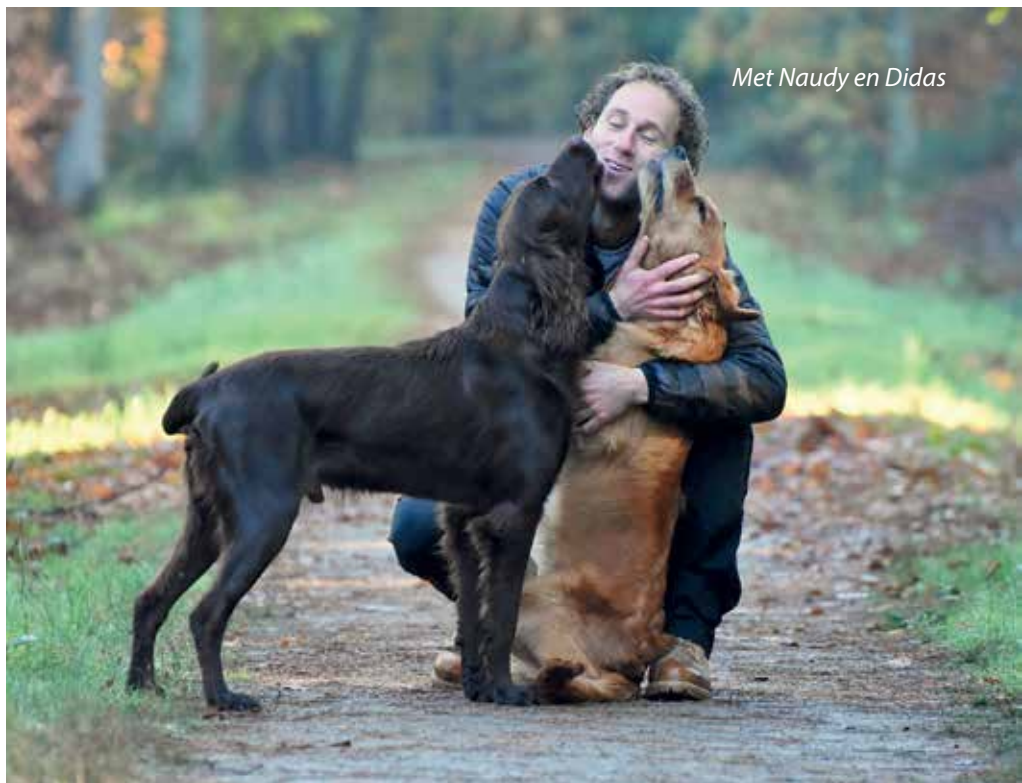
Met Naudy en Didas